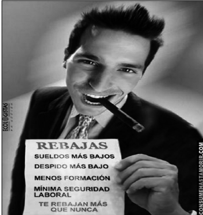
Imagen nº 6